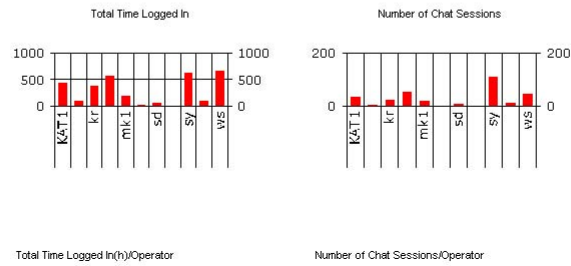
Total Time Logged In(h)/Operator